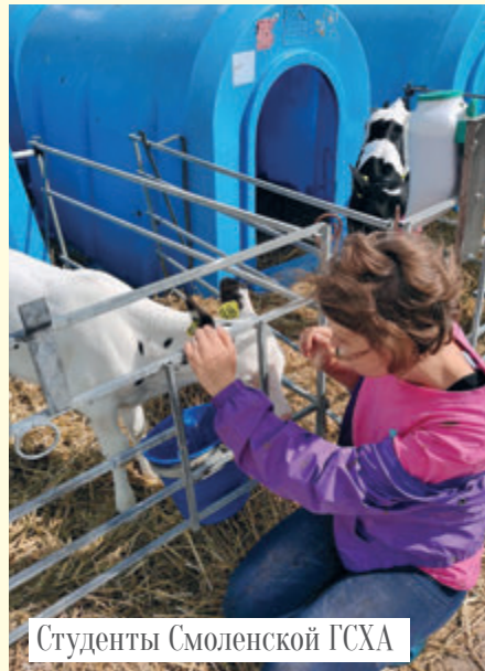
Студенты Смоленской ГСХА

Интересен также научный вектор развития отношений. Он включает в себя проведение совместных научных исследований на базе предприятий агрохолдинга: научных онлайн-конференций с возможностью публикаций статей в сборниках академии.