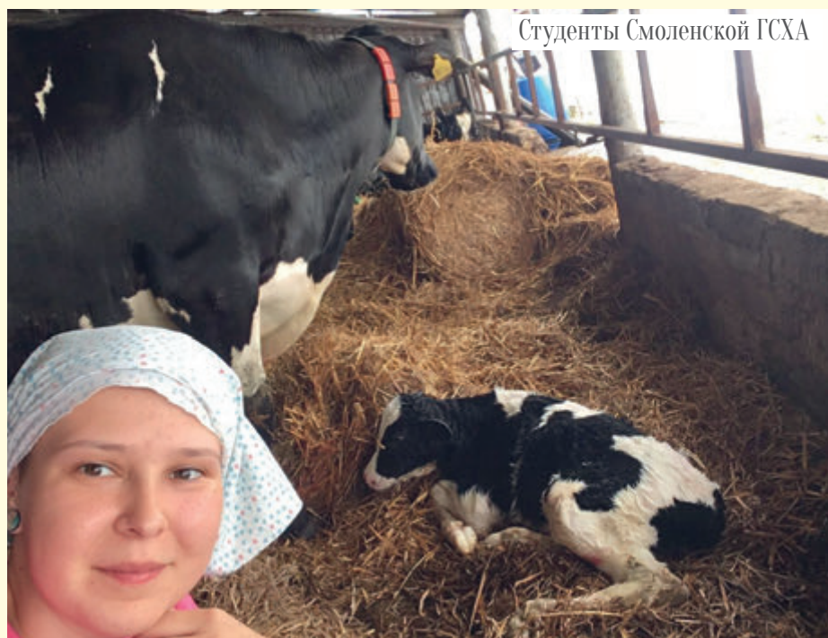
Студенты Смоленской ГСХА

Итогом взаимовыгодного партнерства академии и агрохолдинга «Долгов Групп» станет насыщение рынка труда квалифицированными выпускниками, обладающими знаниями, умениями и навыками в профессиональной деятельности.